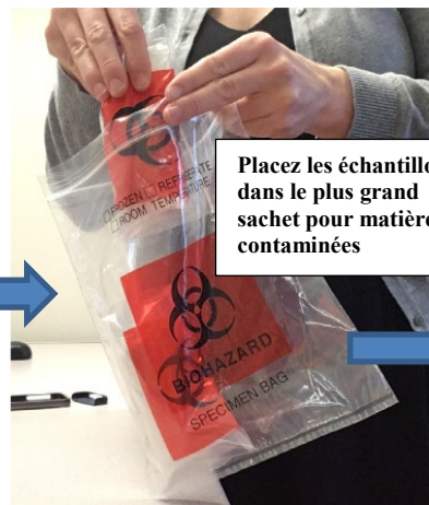
Placez les échantillons dans le plus grand sachet pour matières contaminées