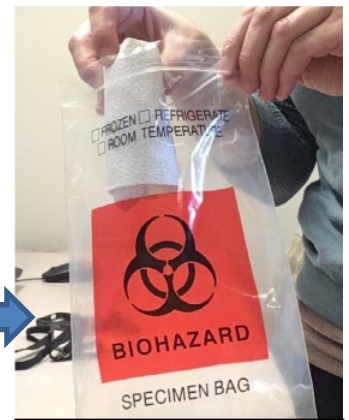
Placez l'échantillon enveloppé d'essuie-tout dans un petit sachet pour matières contaminées