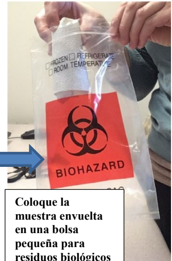
Coloque la muestra envuelta en una bolsa pequeña para residuos biológicos