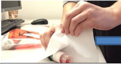
Envuelva el recipiente de la muestra en una toalla de papel